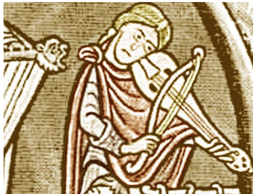
Détail d'une gravure du XII ème s. : "Le roi David avec des musiciens".